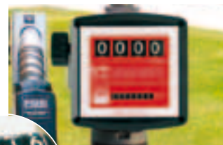
Pulser version available (K44)