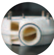
Nutating disk system