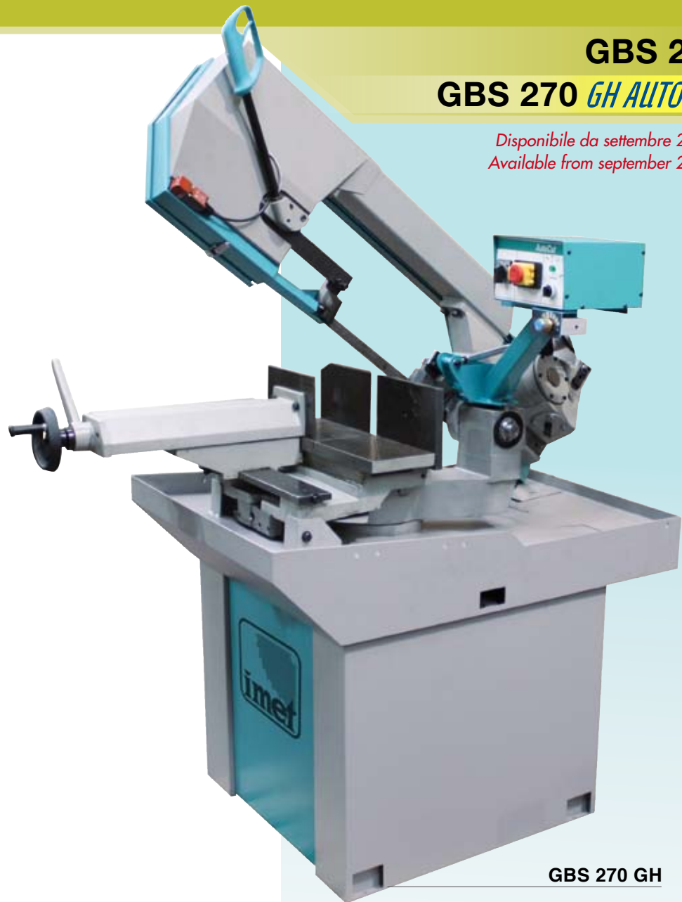
GBS 270 GH

IT - La segatrice versatile della linea GBS per taglio di piccole e medie produzioni di serie sia meccanica che di carpenteria piccola e media per tagli ad angolo fino a 45° destra e 60° sinistra.