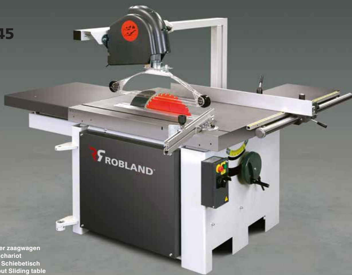
E45 zonder zaagwagen E45 sans chariot E45 ohne Schiebetisch E45 without Sliding table