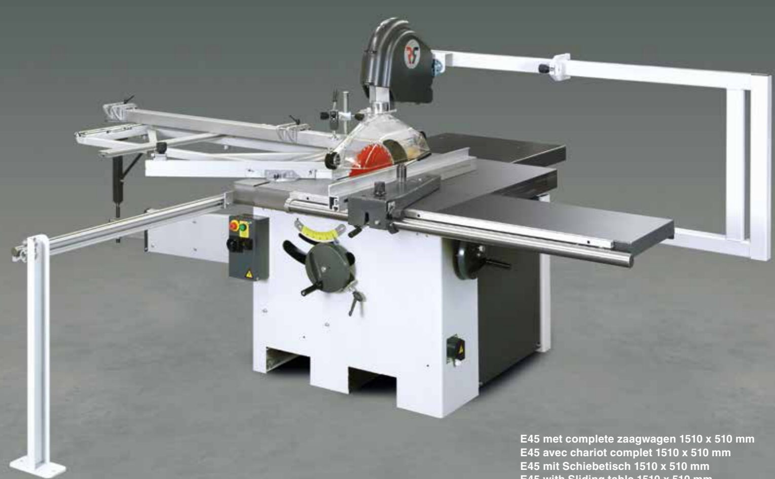
E45 met complete zaagwagen 1510 x 510 mm E45 avec chariot complet 1510 x 510 mm E45 mit Schiebetisch 1510 x 510 mm E45 with Sliding table 1510 x 510 mm