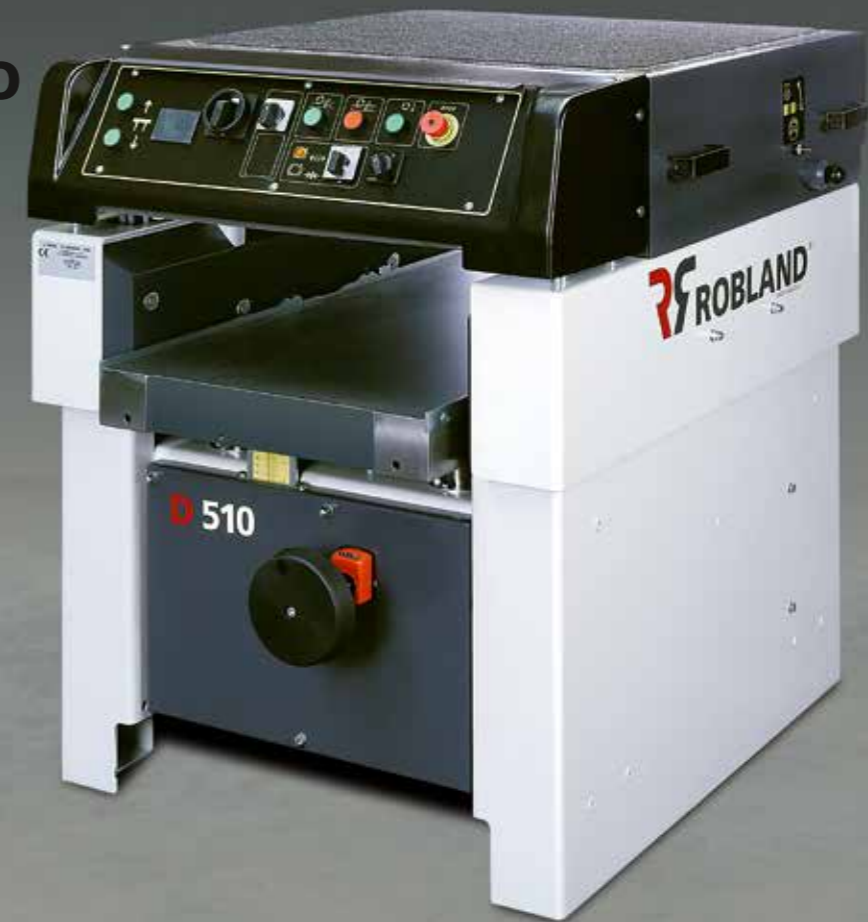
Machine afgebeeld met opties Machine avec plusieurs options Maschine mit verschiedene Optionen Machine with several options