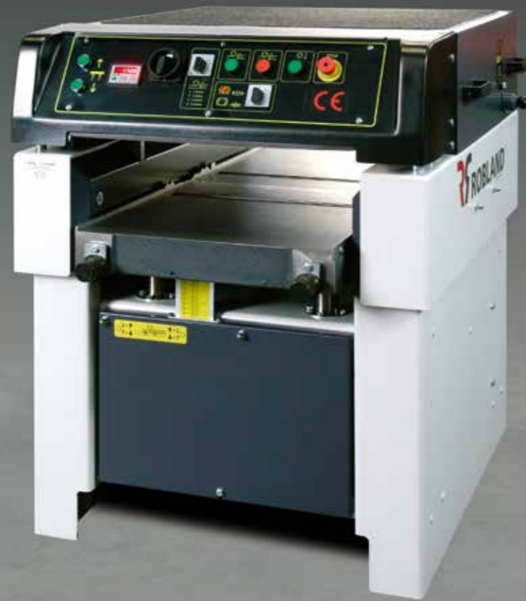
Machine afgebeeld met opties Machine avec plusieurs options Maschine mit verschiedene Optionen Machine with several options