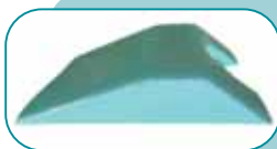
Oasis Elite Prone & Lateral Positioning system