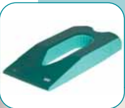
EL904 Oasis Elite Large Prone Positioner