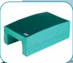
EL800 Oasis Elite Lateral Leg Positioner